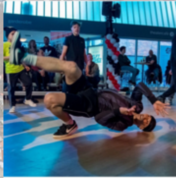
3 vind-ik-leuks sportendelft Delftse Sportweek Programma 📌 Wat: Breakdance-Clinic & Cypher Jam 📌 Wie: Kinderen, Jongeren & Volwassenen 📌 Waar: House of Styles 📌 Wanneer: 18 september 2022 vanaf 14.00