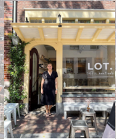
401 vind-ik-leuks lot.delft LOT is 21 📍 net als twee jaar geleden is het wéér bloedheet buiten, heb ik ook alweer wat over m'n jurk heen laten vallen (classic me, check de stories) en was het ook vandaag weer een feestje om voor jullie koffietjes te mogen zetten! ☺️❤️ bedankt voor alle kletspraatjes, bezoeken en meer! tot snel!