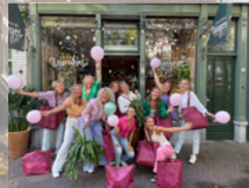
722 vind-ik-leuks groenevingersdelft 6 JAAR! 🥳❤️ Wij zijn jarig!!! Hoera! Het is zo cliché maar wat gaat de tijd toch snel! We zijn zo blij met al onze lieve klanten en willen jullie super bedanken. 🥰 Omdat we jarig zijn hebben we een feestweekend met leuke plantentacties, de start van ons spaarsysteem Groene Vingertjes sparen, we hebben 3 kleurrijke nieuwe tassen 🥰 en bij een besteding van €10,00 mag je zoals ieder jaar op onze verjaardag aan ons rad van fortuin draaien, altijd prijs! 🥳 Kom je gezellig langs dit weekend? Liefs van het hele team van Groene Vingers 🥰