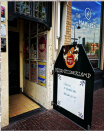
4 vind-ik-leuks bierhuisdeklomp "Geluk is houden van dat wat je hebt". Het buitenbord hebben we voorzien van nieuwe wijsheid ☺️ #cafe #cafeleven #indelft #delft #buiten #biercafe #wijsheid