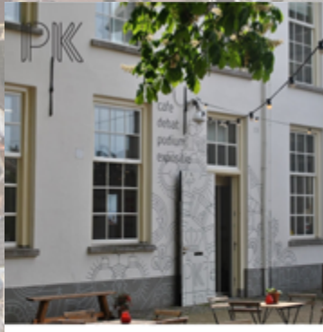
24 vind-ik-leuks prinsenkwartier_delft Bij Prinsenkwartier Delft gaan kennis maken en kennismaken hand-in-hand. Om zo nog meer betekenis te geven aan leven in Delft. Want leven in een stad die zichzelf steeds opnieuw uitvindt, kent steeds nieuwe uitdagingen. Uitdagingen die vragen om andere invalshoeken en nieuwe verbindingen. Om samenkomst in een tijd en ruimte waar (vorm)geven en (deelnemen) elkaar ontmoeten.