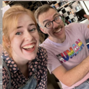
68 vind-ik-leuks koffiezoedelft Ook vandaag zijn we er weer om lekkere koffies voor jullie te maken! Tot koffie & zo! #Delft #baristalife #coffeelife #koffietijd #nDelft #flattie #flatwhite #indebuurt #koffie #visitdelft #coffee #instaDutch #espresso #specialtycoffee hemelsebloemendelft 🥰