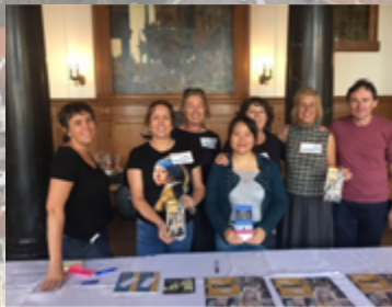
15 vind-ik-leuks monumentdelft We zouden best nog een vrijwilliger kunnen gebruiken die op zaterdag 10 of zondag 11 september in het Stadhuis meehelpt in de informatie stand van Open Monumentendag Delft. Bezoekers komen het programmaboekje ophalen en willen soms uitleg of tips. Kan je goed tegen drukte en promoot je graag Delft dan is dit echt iets voor jou! Voor een hele dag meehelpen is een bescheiden vergoeding beschikbaar. Heb je tijd? Mail naar kantoor@openmonumentendagdelft.nl.