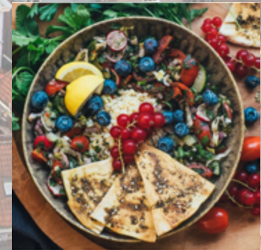
46 vind-ik-leuks wildgroei.delft One of our wonderful dishes is the fattoush with crispy flatbread. A delicious refreshing salad with bulgur, tomatoes, cucumber, summer berries, parsley, and mint. Perfect for cooling off during this season's heat 🥰