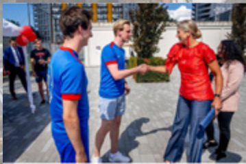
613 vind-ik-leuks gemeente.delft Hoog bezoek! 🥰 Vandaag brachten Koningin Máxima en minister Dijkgraaf een bezoek aan de activiteitenmarkt van de @oweedelft Delft. Als erevoorzitter van stichting MIND Us maakt Koningin Máxima zich hard voor het mentale welzijn van jongeren. Tijdens haar bezoek sprak ze met verschillende studenten die zich ook hiervoor inzetten. 🥰 #Delft