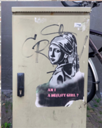
26 vind-ik-leuks lartcourtlesmurs (G) 📍: @noir.t.e #delft #delftcity #paysbas #streetphotography #streetart #streetartist #streetartphotography Alle 4 opmerkingen bekijken freaksthefab De rien @noir.t.e . visitdelft 🥰