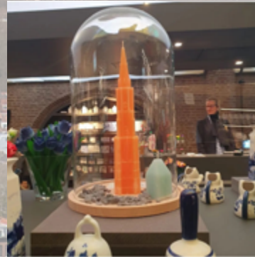
32 vind-ik-leuks stadskaaarsenmakerijdelft Gespot door onze vriendin in de winkel van de Nieuwe Kerk in Delft. Onze ambachtelijk gemaakte torenkaars. Dit oranje exemplaar staat te pronken onder de speciale stolp. En in de winkel hangen de luxe tassen met de torenkaars. Nu te koop in de winkel van de Nieuwe Kerk of direct bij de Stadskaaarsenmakerij Delft. #delft #nieuwekerkdelft #kaarsen #torenkaars #ambacht #cadeau Alle 8 opmerkingen bekijken delftskwartet Wat mooi! 🥰